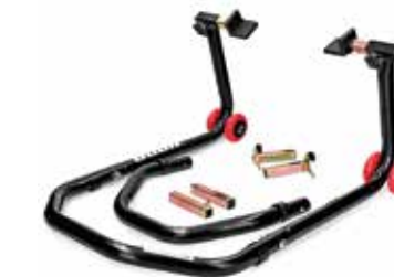
UNIVERSAL VOCA STAND 2 IN 1 0/W00.210.0001