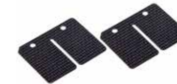
REED PETALS VOCA RACING CARBON BIAxIAL 0/W05.600.0001