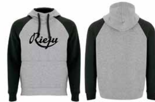
0/000.001.0349 Classic Hoodie