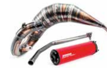
EXHAUST VOCA CROSS ROOKIE ■ 0/W00.290.0003 ■ 0/W00.290.0004