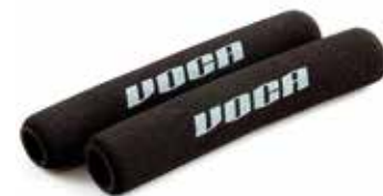
BRAKE LEVER SLEEVES VOCA RACING ■ 0/W00.430.0001 ■ 0/W00.430.0002