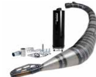
EXHAUST VOCA ROOKIE ■ 0/W00.290.0008 ■ 0/W00.290.0009