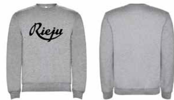
0/000.001.0337 Sweatshirt Basic Classic