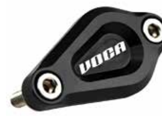
OIL PUMP COVER VOCA EVO ■ 0/W05.640.0003 ■ 0/W05.640.0004