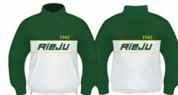
0/000.001.0343 Sweatshirt Vintage Green 1942