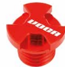
OIL CAP VOCA STYLE ■ 0/W00.460.0001 ■ 0/W00.460.0002