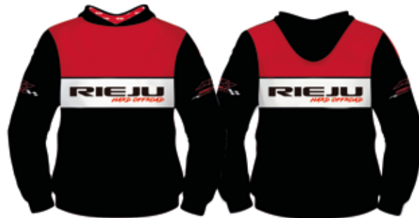
0/000.001.0286 Sweatshirt Paddock