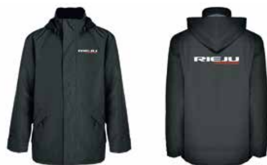
0/000.001.0324 Jacket Paddock