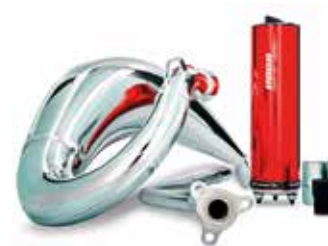
EXHAUST VOCA CROSS CHROMED ■ 0/W00.290.0001 ■ 0/W00.290.0002