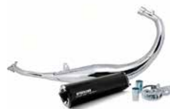
EXHAUST VOCA CHROMED ■ 0/W00.290.0006 ■ 0/W00.290.0005