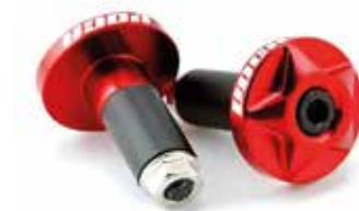
HANDLEBAR ENDS VOCA RACING ■ 0/W00.170.0003 ■ 0/W00.170.0005 ■ 0/W00.170.0004 ■ 0/W00.170.0002