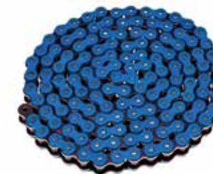
CHAIN VOCA REINFORCED ■ 0/W01.050.0007 ■ 0/W01.050.0003 ■ 0/W01.050.0005 ■ 0/W01.050.0004 ■ 0/W01.050.0002