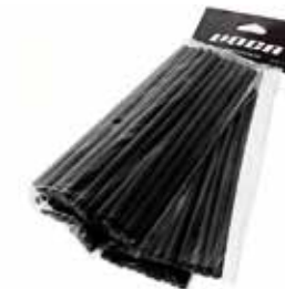
SPOKE COVERS VOCA RACING ■ 0/W00.540.0001 ■ 0/W00.540.0008 □ 0/W00.540.0005 ■ 0/W00.540.0007 ■ 0/W00.540.0004