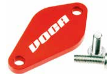
OIL PUMP COVER VOCA STYLE ■ 0/W05.640.0001 ■ 0/W05.640.0002